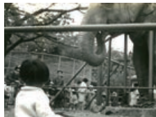
かつて高知城内にあった高知市立動物園(個人蔵)

明治から平成にかけて撮影された高知城関連の写真を紹介します。(生まれまちブース)