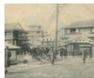
大正末期の高知市新京橋

明治から平成にかけて高知市中心部で撮影された古写真を展示します。*8:00~19:00(入館は18:30まで) *会場/龍馬の生まれまち記念館2階ふれあいホール *要入館料(一般300円)