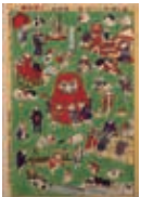
「しん板ねこの世界」

当館が所蔵する貴重資料のパネル展です。 *9:00~18:00 *会場/3階展示室 *無料・申込不要