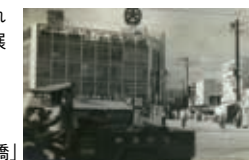
「かつての高知大丸と使者屋橋」

明治から平成にかけて撮影された高知市中心部の古写真を展示します。(生まれたまちブース)