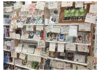
地元高校図書部との連携展示の様子