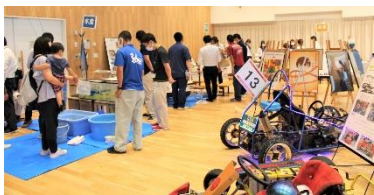
R3年度連携 産業教育PRイベント