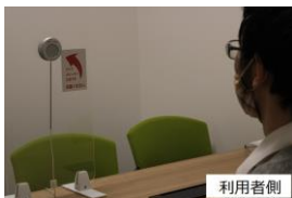
感染防止対策として対面音訳は利用者と音訳者が別室で実施