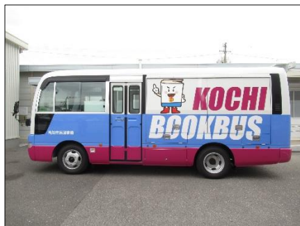
新しくなった 移動図書館バス (2021.3)