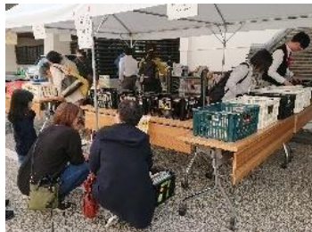
お城下文化の日での リサイクル本の配布