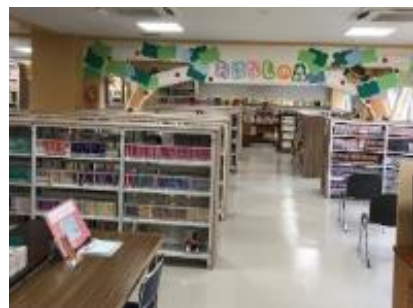
リニューアルした 潮江分館 (2020.7)