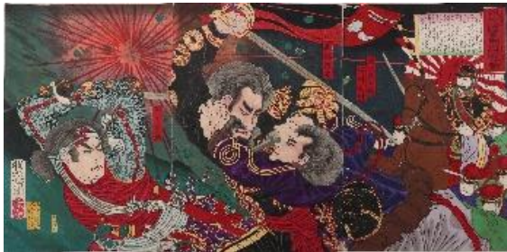
高知市民図書館蔵 近森文庫「城山大進撃西郷決戦之図」明治10年10月9日