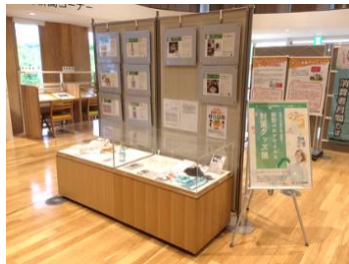
コロナ関連製品展示の様子