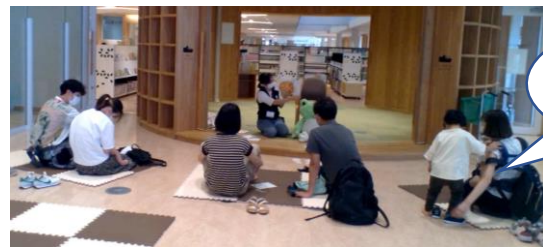
おはなし会の様子