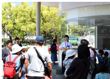
第12回まちゼミ 「津波からのサバイバル」