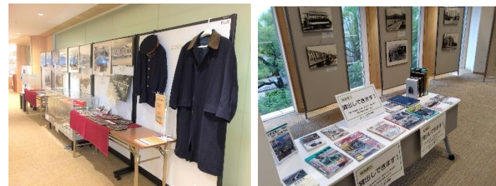
パネル展示「路面電車展」 (連携：高知市暮らし・交通安全課)