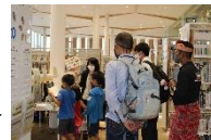
やさしい日本語による館内ツアーの様子