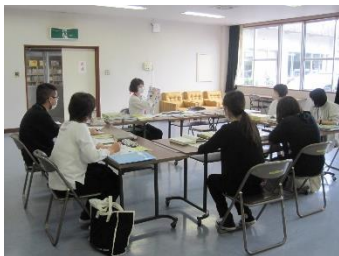
市町村での研修の様子