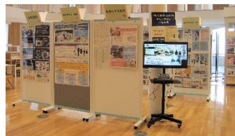
R3年度連携パネル展 「県立高校における新しい学び」