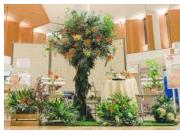
こうちのohana満開プロジェクト