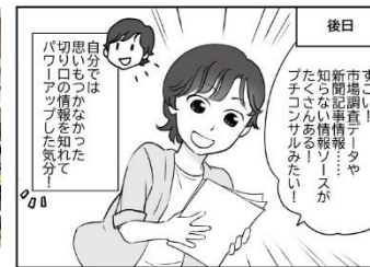
活用事例まंगा No.1 (連携：高知県移住促進課)