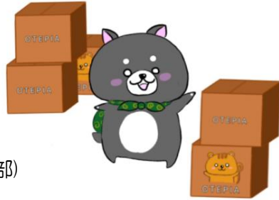
イラスト etc…さん(ティーンズ部)