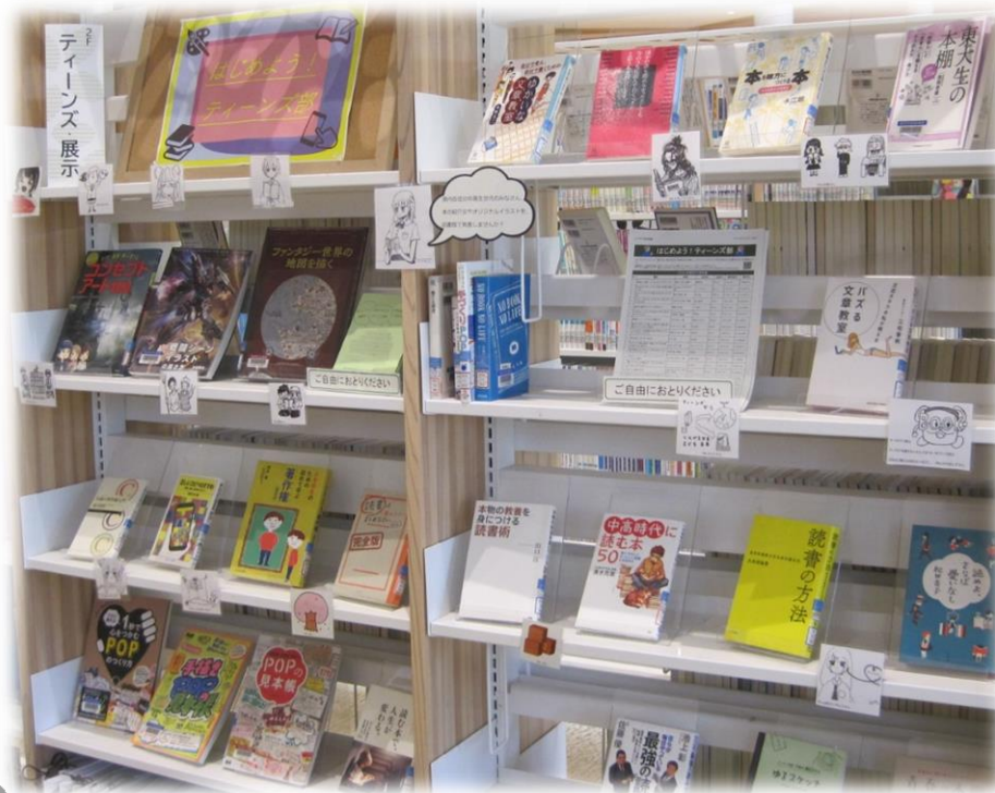
展示の様子 ※令和3年6月30日まで