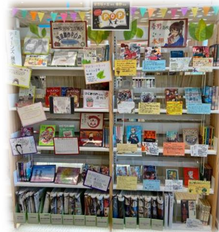
2021年11月～12月 安芸桜ヶ丘高校・春野高校

A. オススメしたい本を紹介するためのメッセージカード。POPを見た人が「おっ！」と思うキャッチコピーやイラストなどで、本の魅力を伝えます。