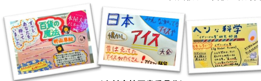
(中村高校図書委員作)