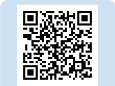
▲図書館ウェブ・サイト