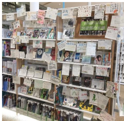
▲高知農業高校図書部による図書展示

県内の県立学校等と連携して、オーテピア高知図書館の本棚やスペースを活用した展示を行っています。協働して展示を行うことで、若い世代の読書や図書館利用の習慣化につなげるとともに、学校のPRを行います。