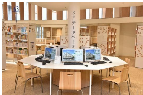
データベースコーナー