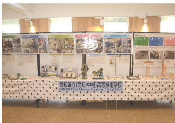
▲高知県立高等技術学校の訓練生の作品と関連図書の展示